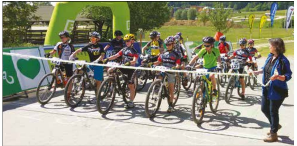
Der Start bei den Mountainbikemeisterschaften