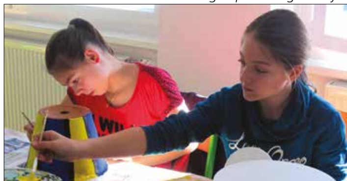
Trommelbau im Rahmen der Musik-Projektwoche