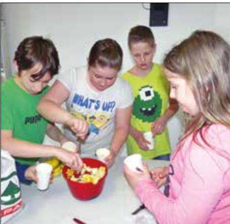
Fruit salad in der 1c