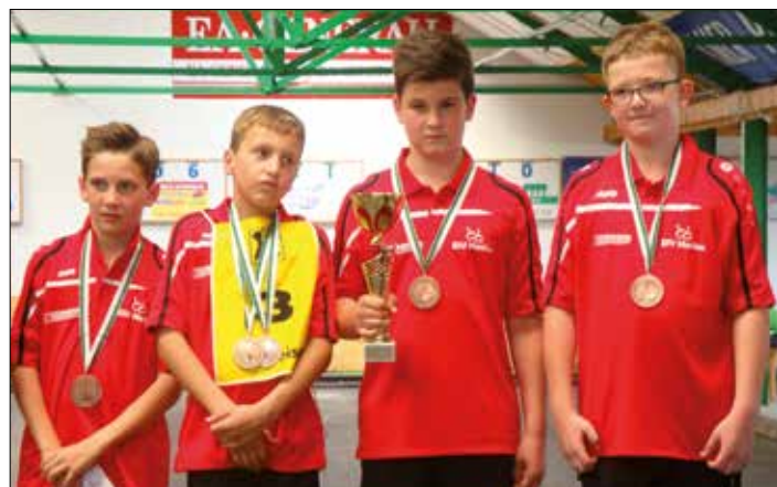
3. Platz bei den Landesstocksportmeisterschaften