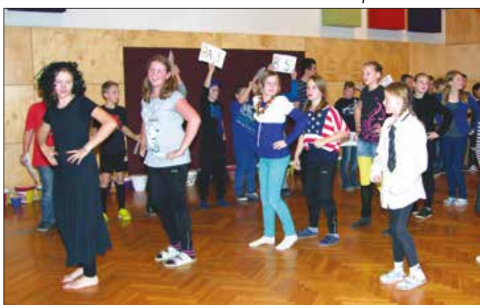
Im Rahmen des Dramaworkshops wurde auch getanzt