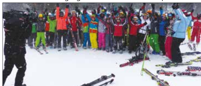
Aufzeichnung der Wettersendung für „Steiermark heute“