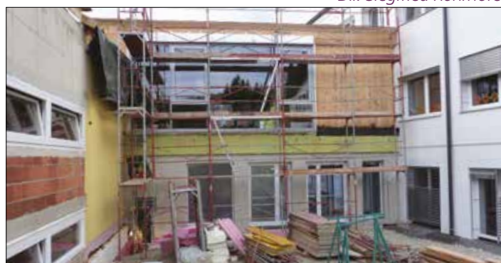
Über dem Foyer befindet sich in Zukunft die Bibliothek