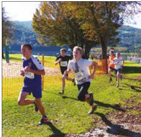
Waldlauf der Jugend in Stubenberg