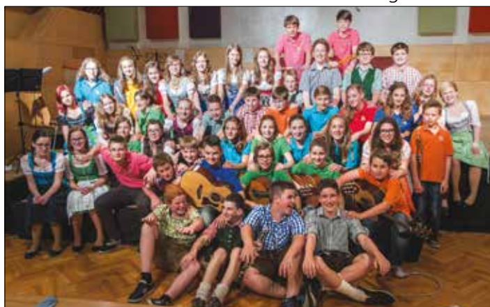
Die Schüler/-innen der 3d und ihre Freunde aus Schlanders