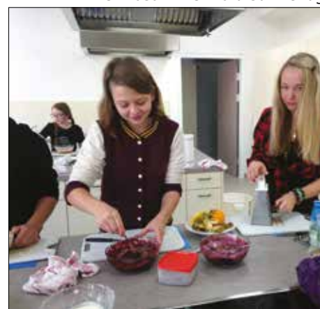
Kochen macht Spaß