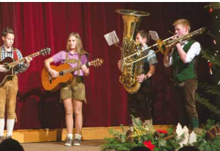
Leitung: Teresa Steiner, BEd