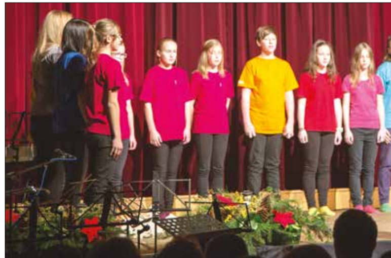
Der Schulchor beim Benefizkonzert