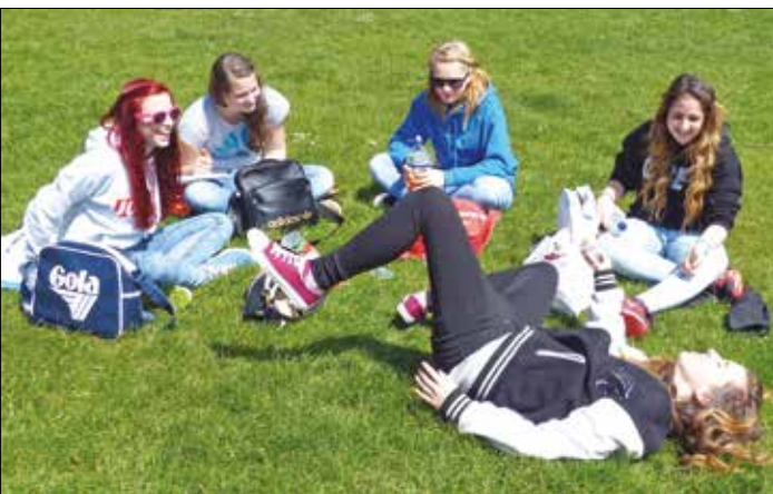
Rast im GreenPark in London