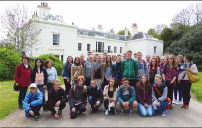
Die Gruppe mit ihren Begleitlehrerinnen vor dem LTC