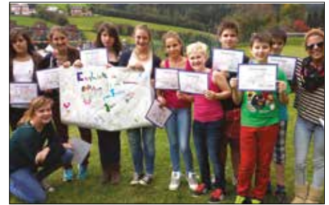
English in Action