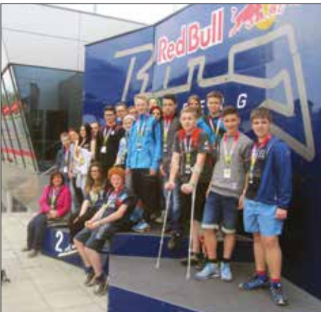
Schülerlotsentag am Red Bull Ring