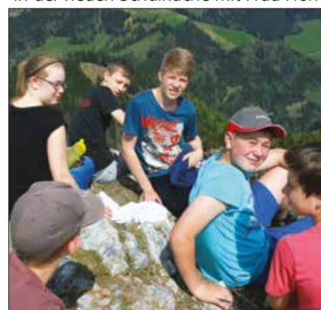
Schüler/-innen der 3c am Plankogel