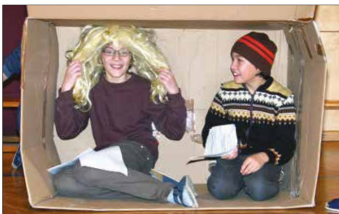
Two in a box - Dramaworkshop der 2. Klassen