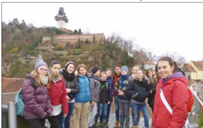
Von der Stadt Graz waren die Gäste besonders begeistert