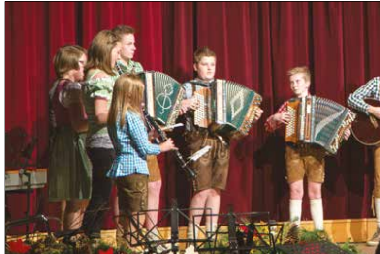
Das Volksmusikensemble der Musikmittelschule Birkfeld