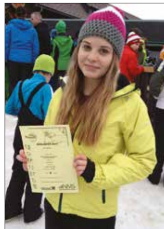
Bezirksschimeisterschaften am Hauereck