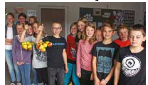
Thema Gesundheit b. Sprachenportfolio