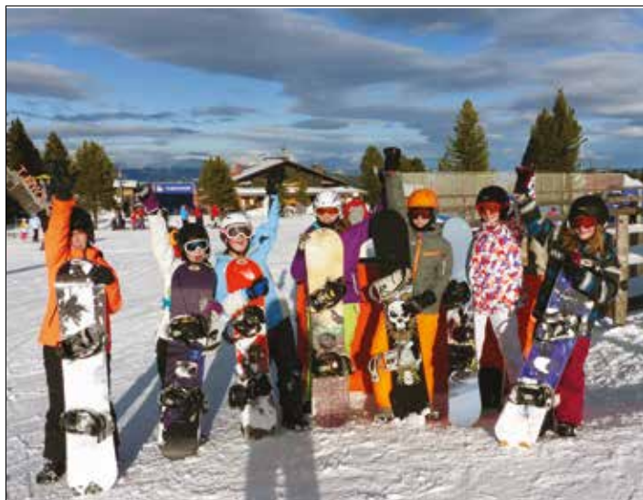
Der Kreischberg eignet sich ideal für Wintersportwochen