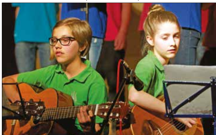
Musikerinnen aus dem Vinschgau - Südtirol