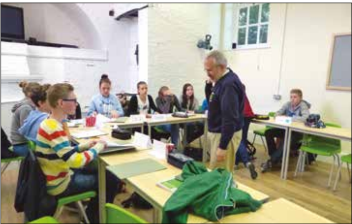
Unterricht im LTC in Eastbourne