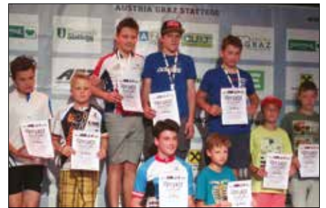
Die siegreichen Mountainbiker