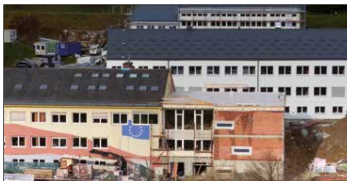
Im Neubau befinden sich Sonderunterrichtsräume und Klassen