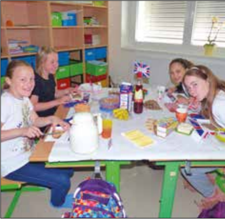
Breakfast in der 1d