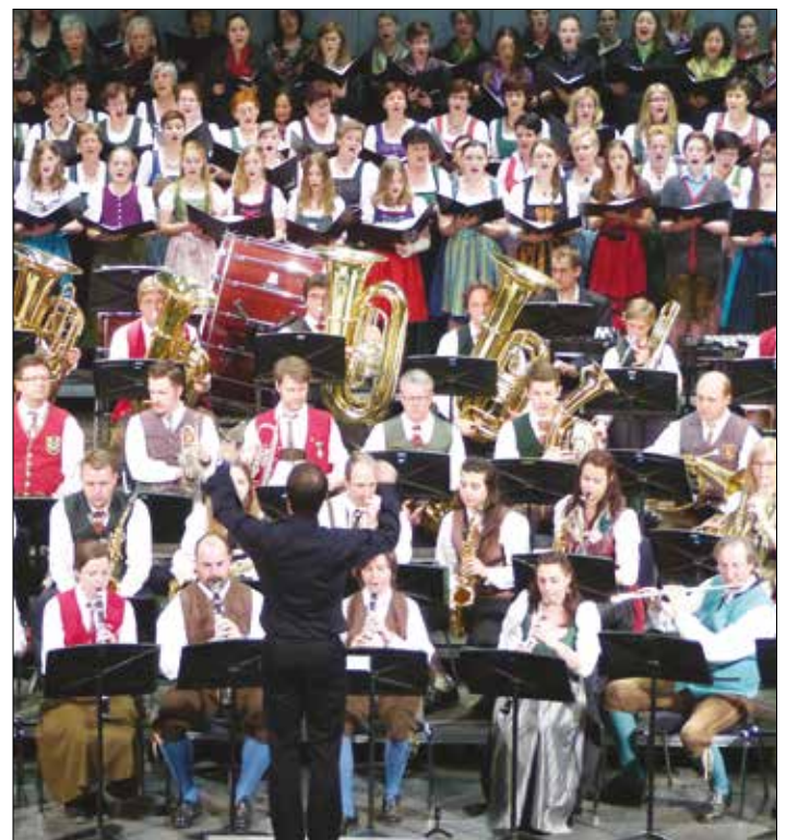
Der Schulchor im Februar bei Opus Styriae in Weiz