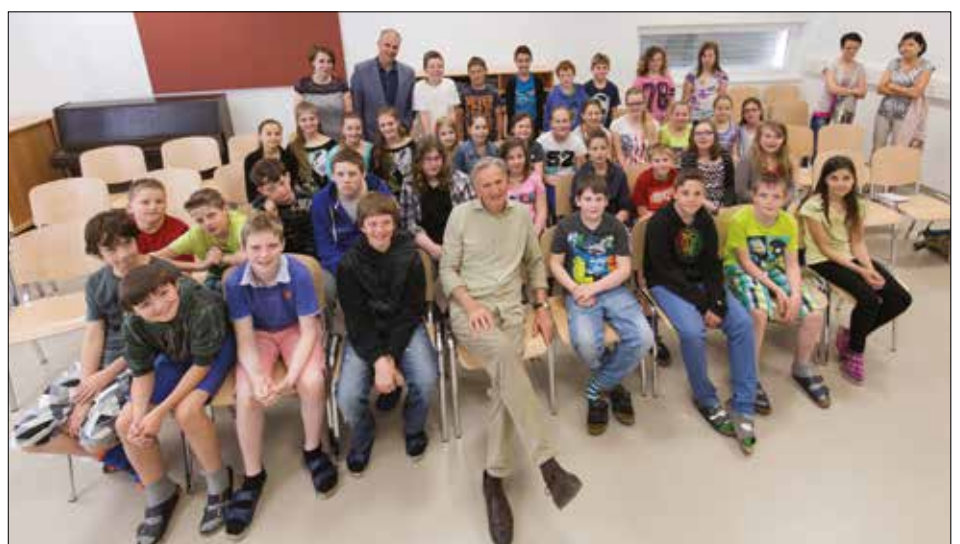
„Schule des Zuhörens“ mit dem berühmten Autor und Erzähler Folke Tegetthoff