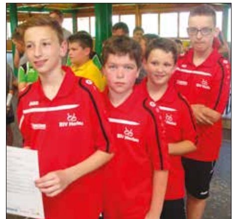
Rang 6 bei den Landesmeisterschaften