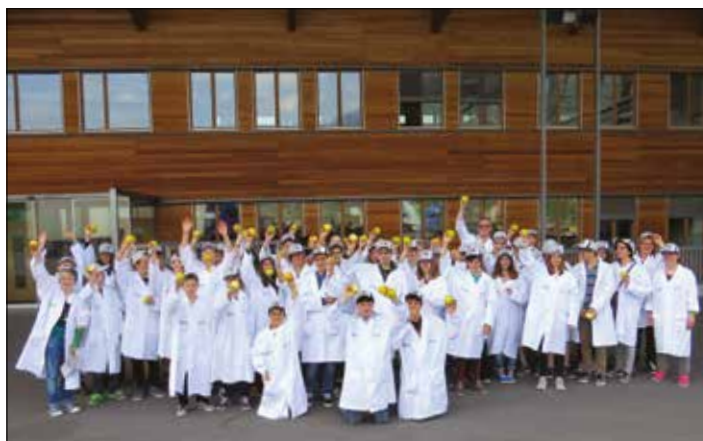
Besuch bei der Obstverwertungsgenossenschaft GEOS